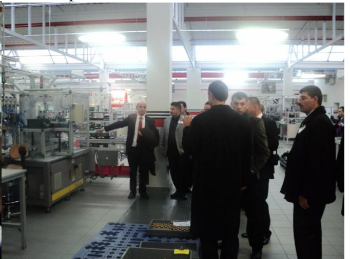
Multivalf Montaj Hatları