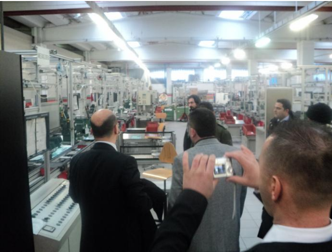
Regülatör Montaj Hatları....(14 adet)