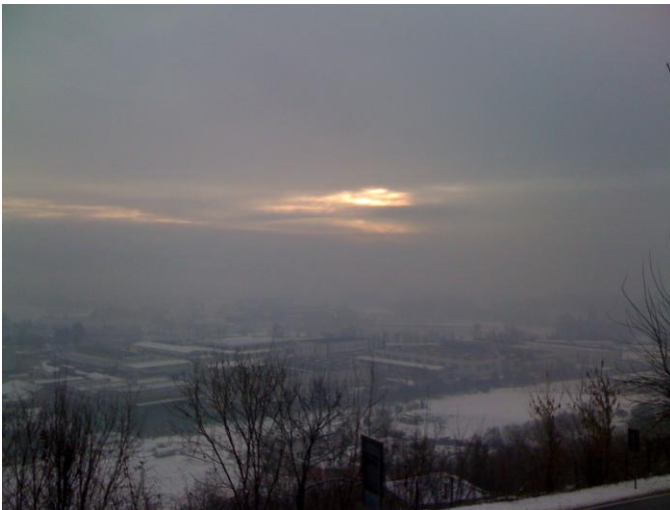
BRC Fabrikaları fotoğrafa sığmayacak kadar büyüktü.