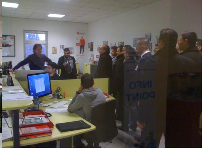
Bayiler her yerde çok sıcak karşılandı. Duvarlarda 2A reklamlarını asılı görmek tatlı bir sürpriz oldu.