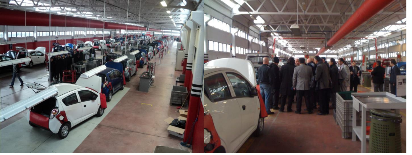
0 Km araçların montaj hattı büyük ilgi çekti