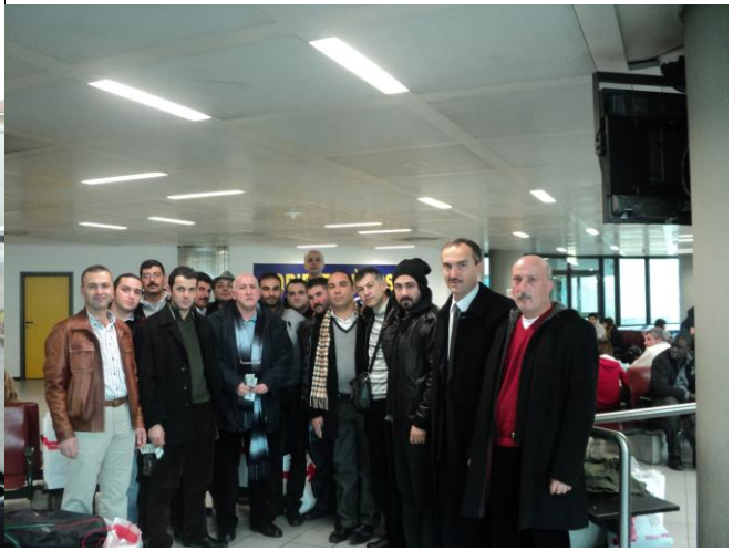
Torino Havalimanında eve dönüş