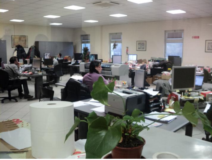
Fabrikanın kalbi Bütün otomasyon ve işlemler bilgisayarlarda kontrol ediliyor.