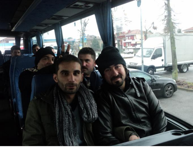
Birbiri ile şakalıırken...