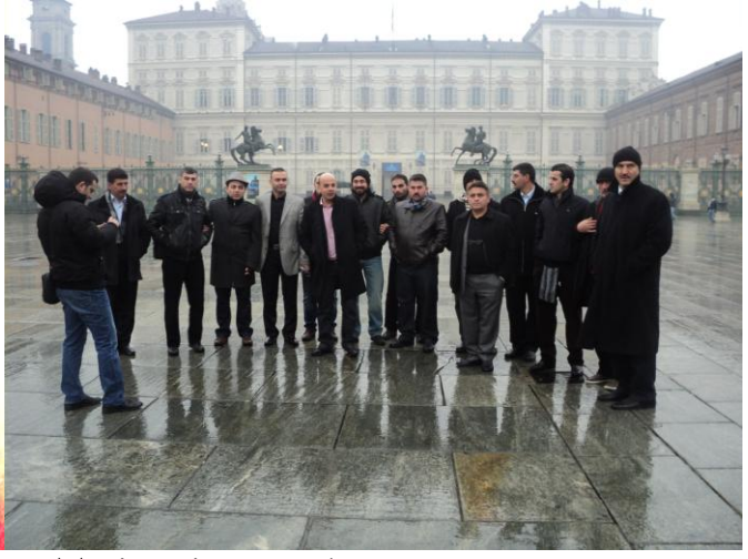
Torino'da Gezerken .....